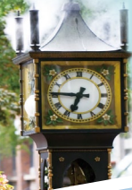
煤氣鎮 - 蒸氣鐘

Morning commence Vancouver city tour to Chinatown, Gastown and Stanley Park. Early afternoon proceed to Canada Place, Flyover Canada (admission not included), Seawall water walk, Winter Olympic Park, Capilano Suspension Bridge (admission not included), Queen Elizabeth Park.